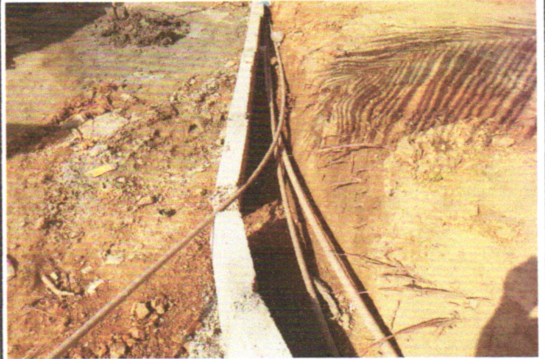
TRAV. JOÃO TAVARES - E0 a E16+14,60 - PENEDO