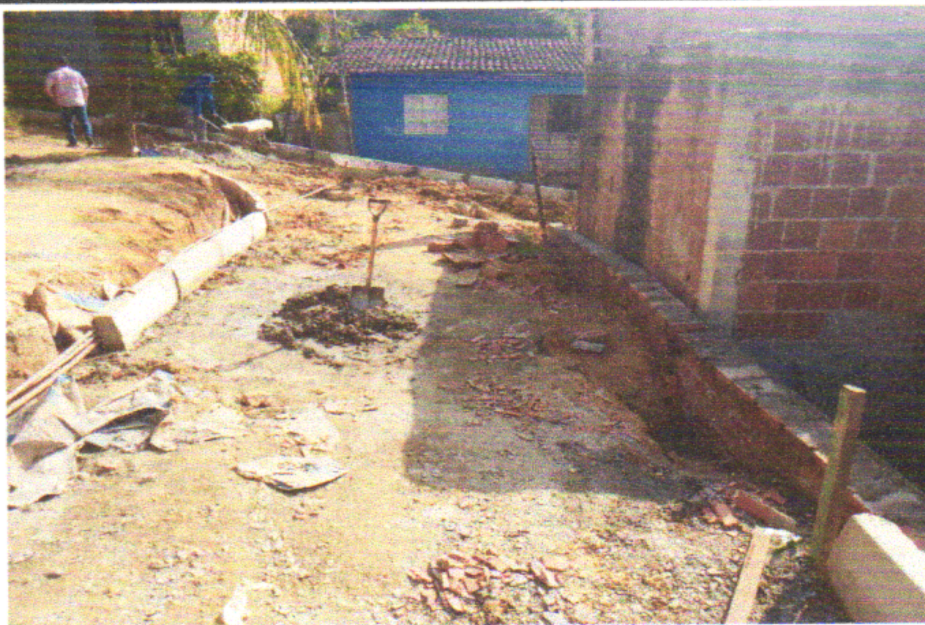
TRAV. JOÃO TAVARES - E0 a E16+14,60 - PENEDO