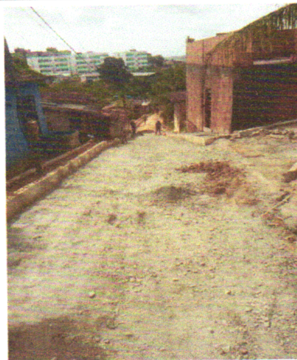
TRAV. JOÃO TAVARES - E0 a E16+14,60 - PENEDO