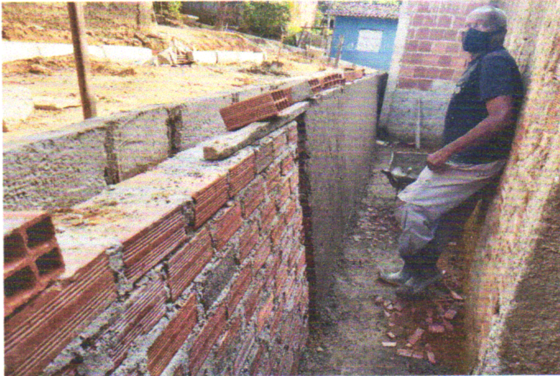
TRAV. JOÃO TAVARES - E0 a E16+14,60 - PENEDO