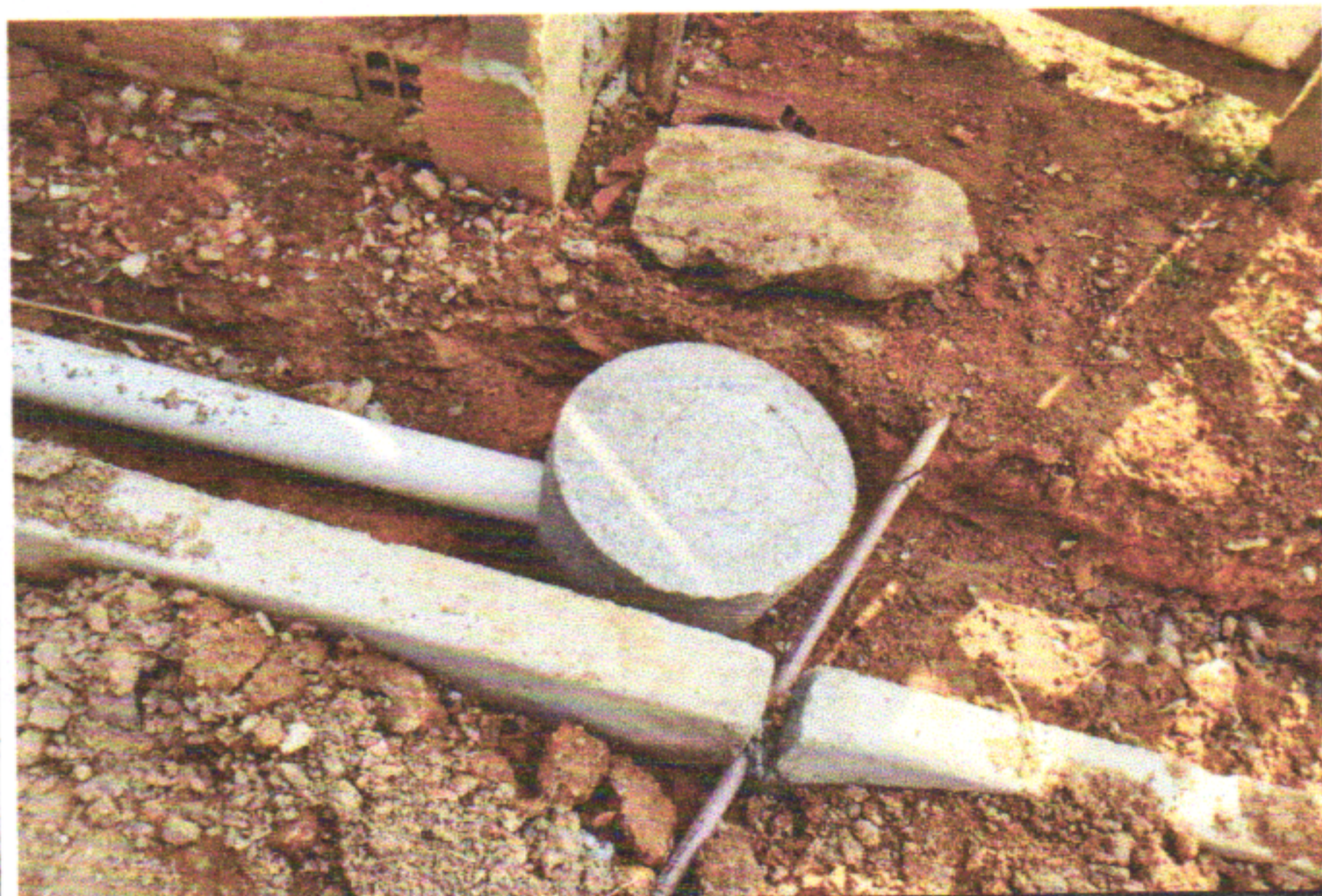
TRAV. JOÃO TAVARES - E0 a E16+14,60 - PENEDO