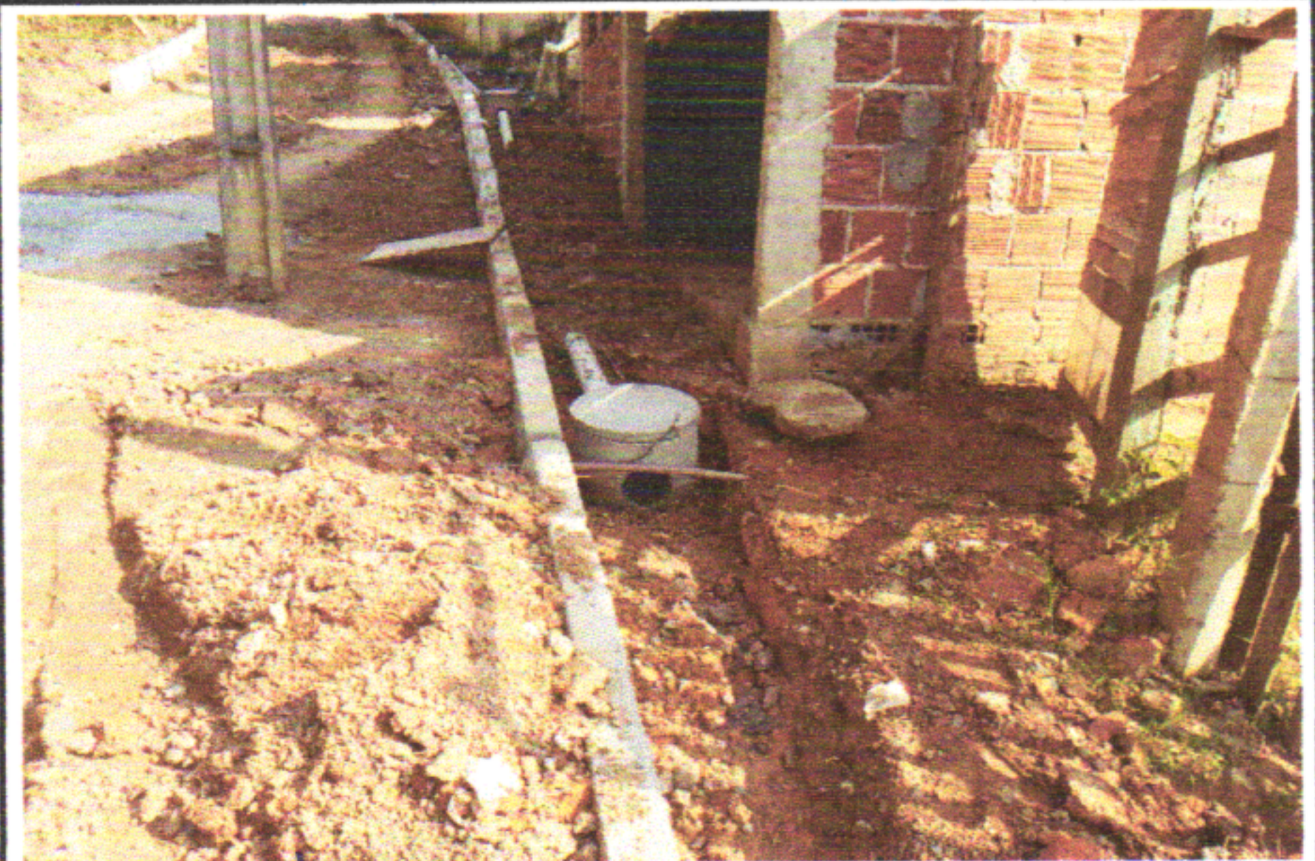
TRAV. JOÃO TAVARES - E0 a E16+14,60 - PENEDO