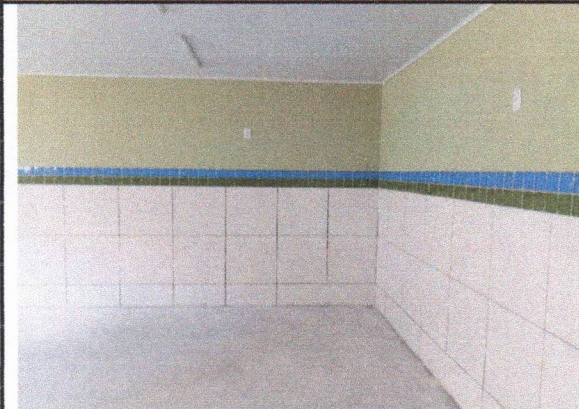
PINTURA LÁTEX ACRÍLICA STANDARD, APLICAÇÃO MANUAL EM PAREDES