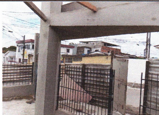
EXECUÇÃO DELAJE, CHAPISCO, MASSA ÚNICA