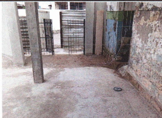
LASTRO E REGULARIZAÇÃO DE PISO