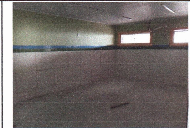
PINTURA LÁTEX ACRÍLICA STANDARD, APLICAÇÃO MANUAL EM PAREDES