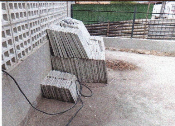
GRADIL, ALVENARIA DE COBOGÓ, CHAPISCO MASSA ÚNICA