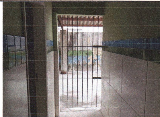
REVESTIMENTO CERÂMICO EM PAREDES