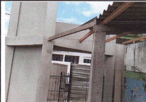
EXECUÇÃO DELAJE, CHAPISCO, MASSA ÚNICA