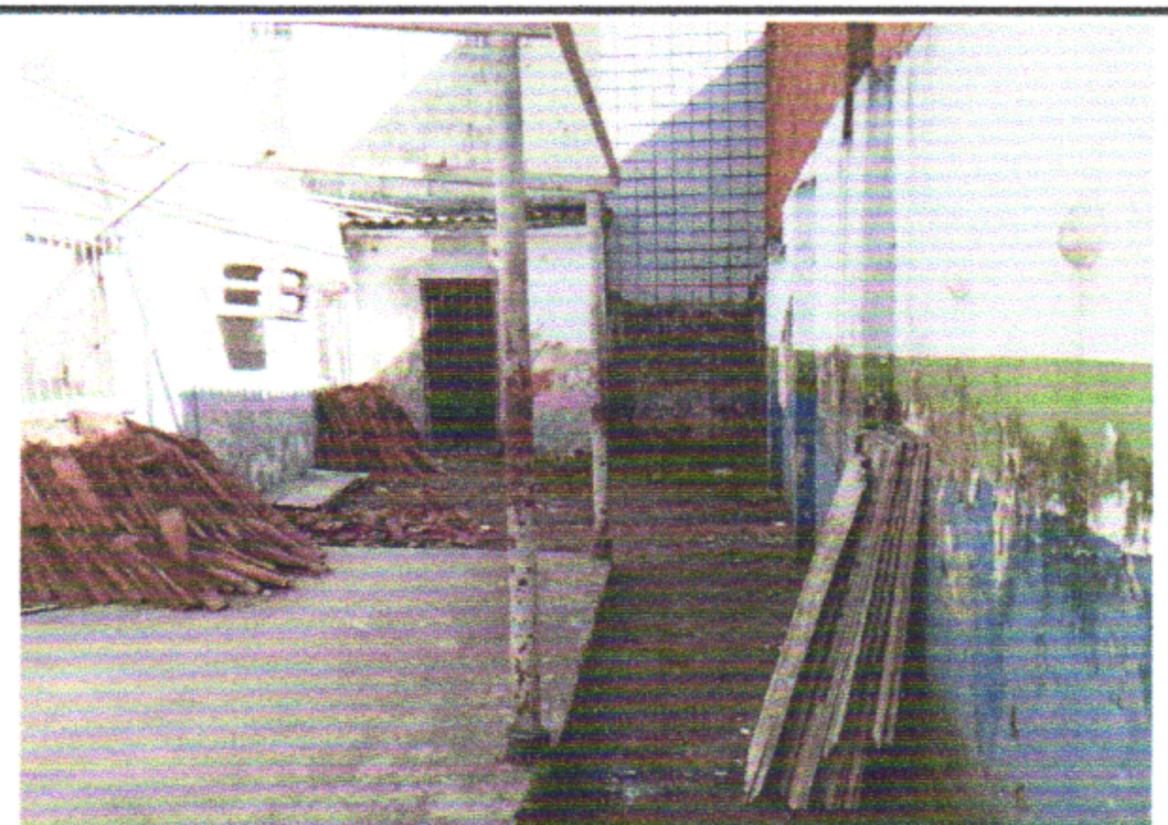
REMOÇÃO DE TRAMA DE MADEIRA PARA COBERTURA, DE FORMA MANUAL, SEM REAPROVEITAMENTO