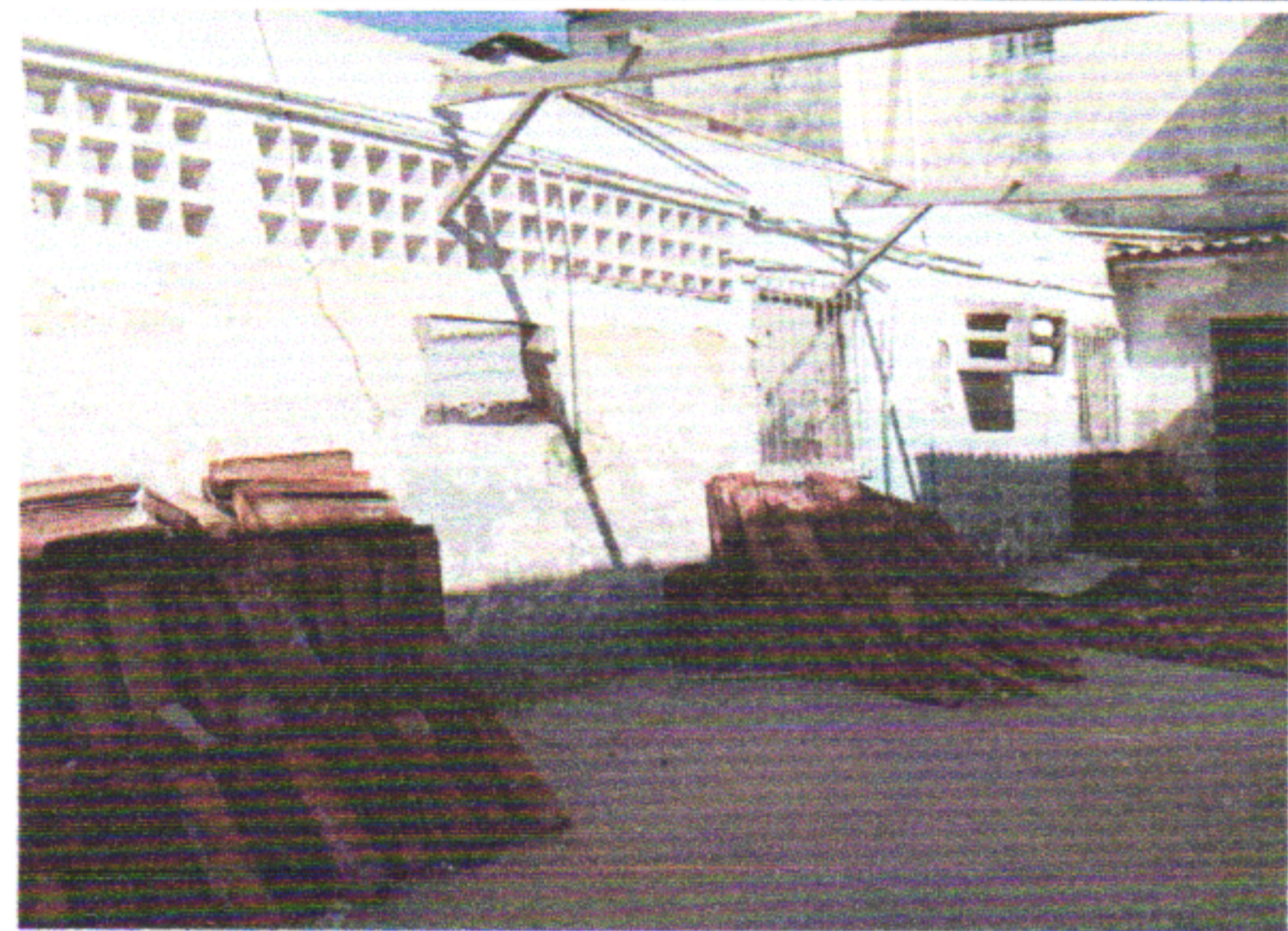
REMOÇÃO DE TELHAS, DE FIBROCIMENTO, METÁLICA E CERÂMICA, DE FORMA MANUAL, SEM REAPROVEITAMENTO