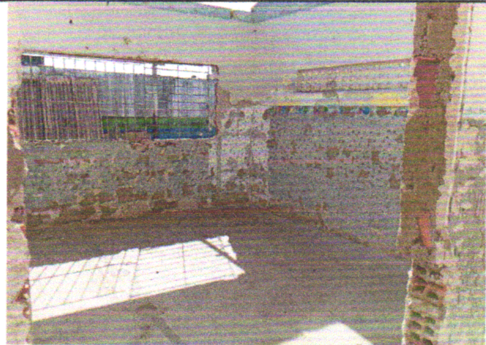
REMOÇÃO DE TRAMA DE MADEIRA PARA COBERTURA, DE FORMA MANUAL, SEM REAPROVEITAMENTO