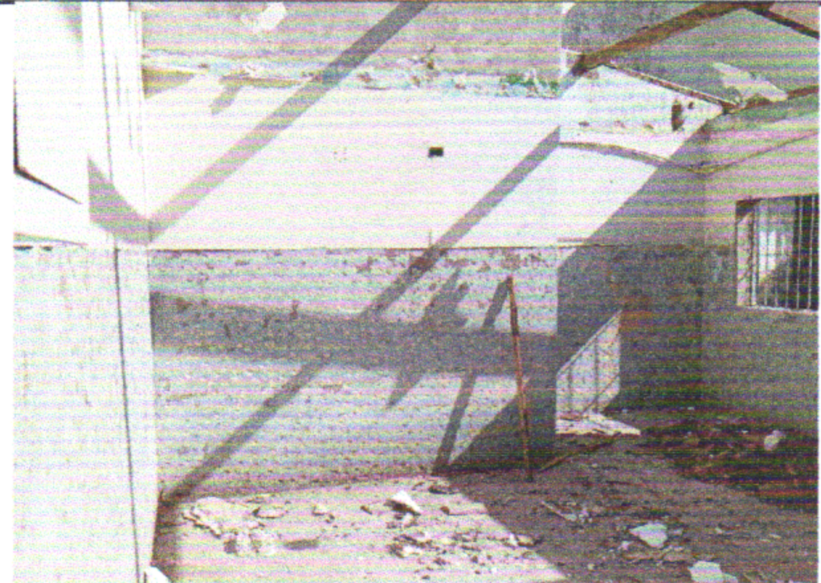
DEMOLIÇÃO DE REVESTIMENTO CERÂMICO, DE FORMA MANUAL, SEM REAPROVEITAMENTO