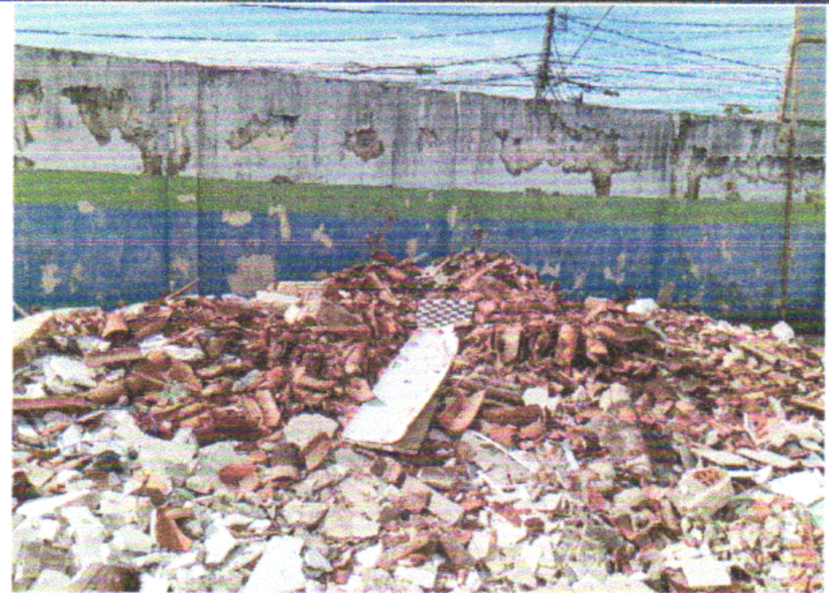
TRANSPORTE HORIZONTAL ATÉ 30M DE MATERIAIS À GRANEL