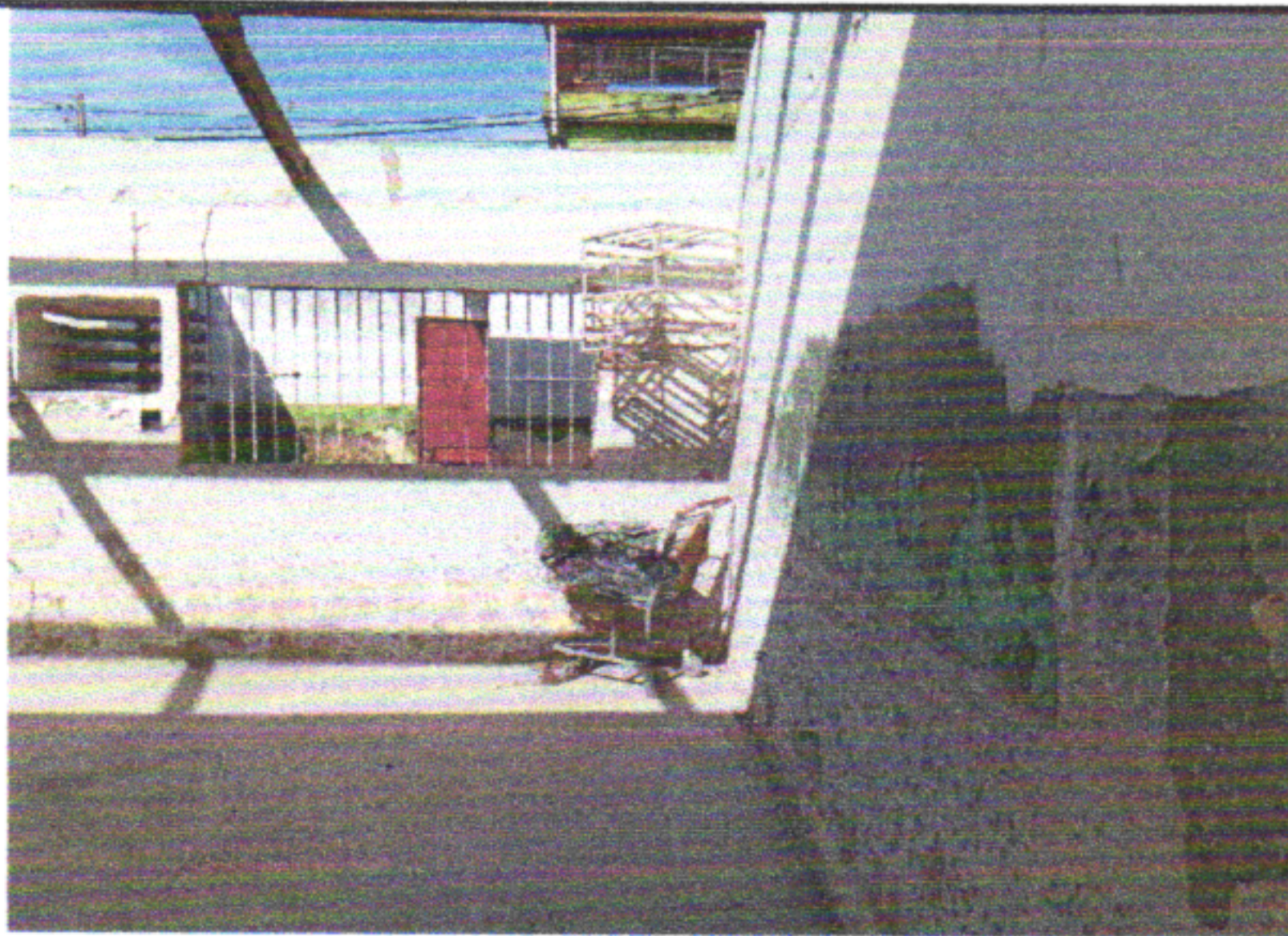
REMOÇÃO DE JANELAS, DE FORMA MANUAL, SEM REAPROVEITAMENTO