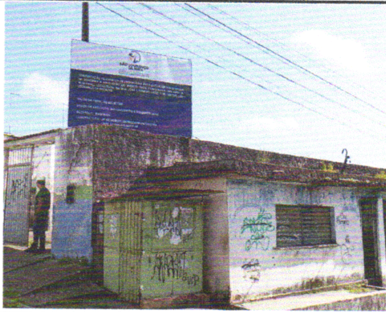
FORNECIMENTO E INSTALAÇÃO DE PLACA DE OBRA COM CHAPA GALVANIZADA E ESTRUTURA DE MADEIRA