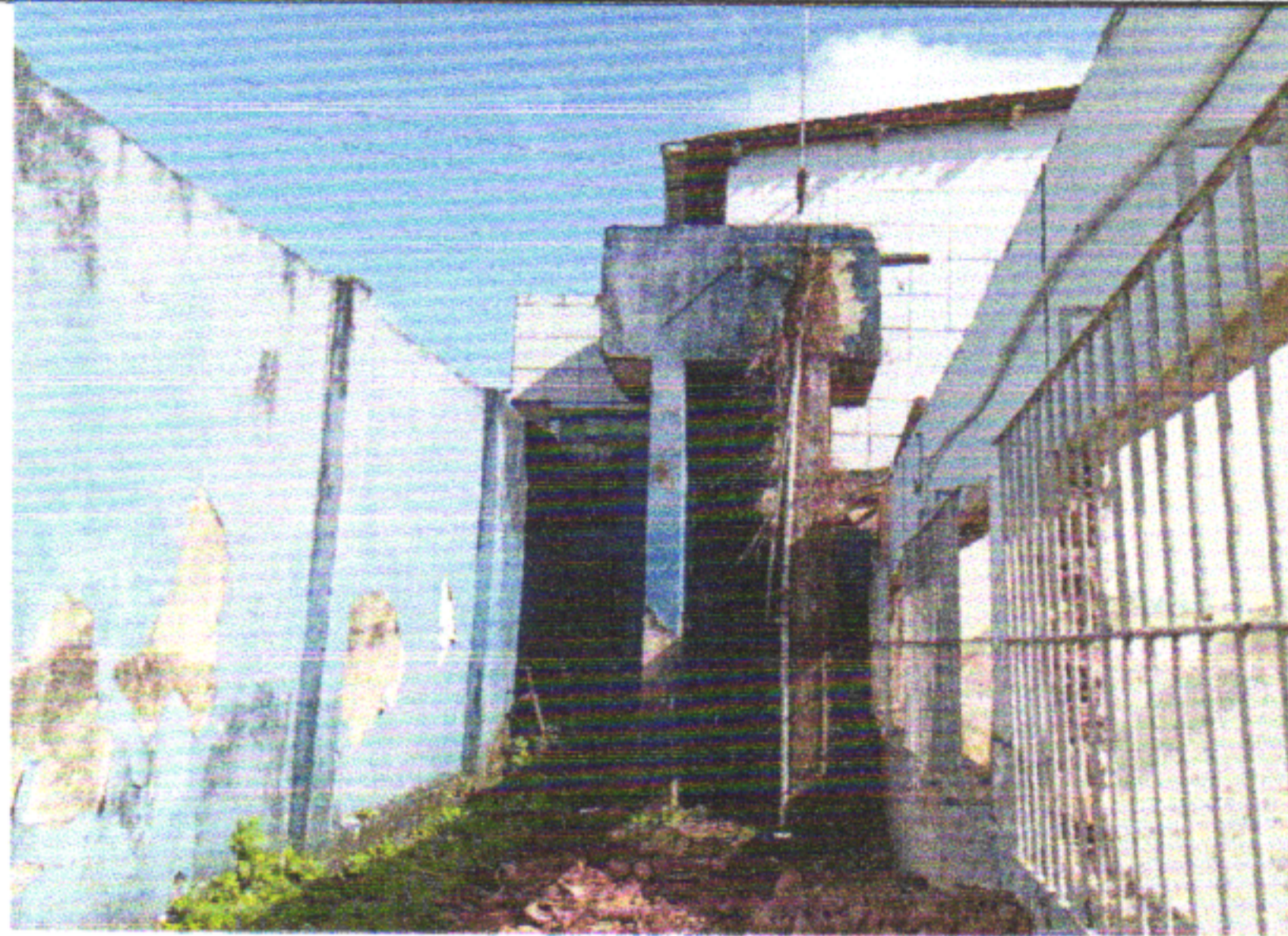
REMOÇÃO DE JANELAS, DE FORMA MANUAL, SEM REAPROVEITAMENTO