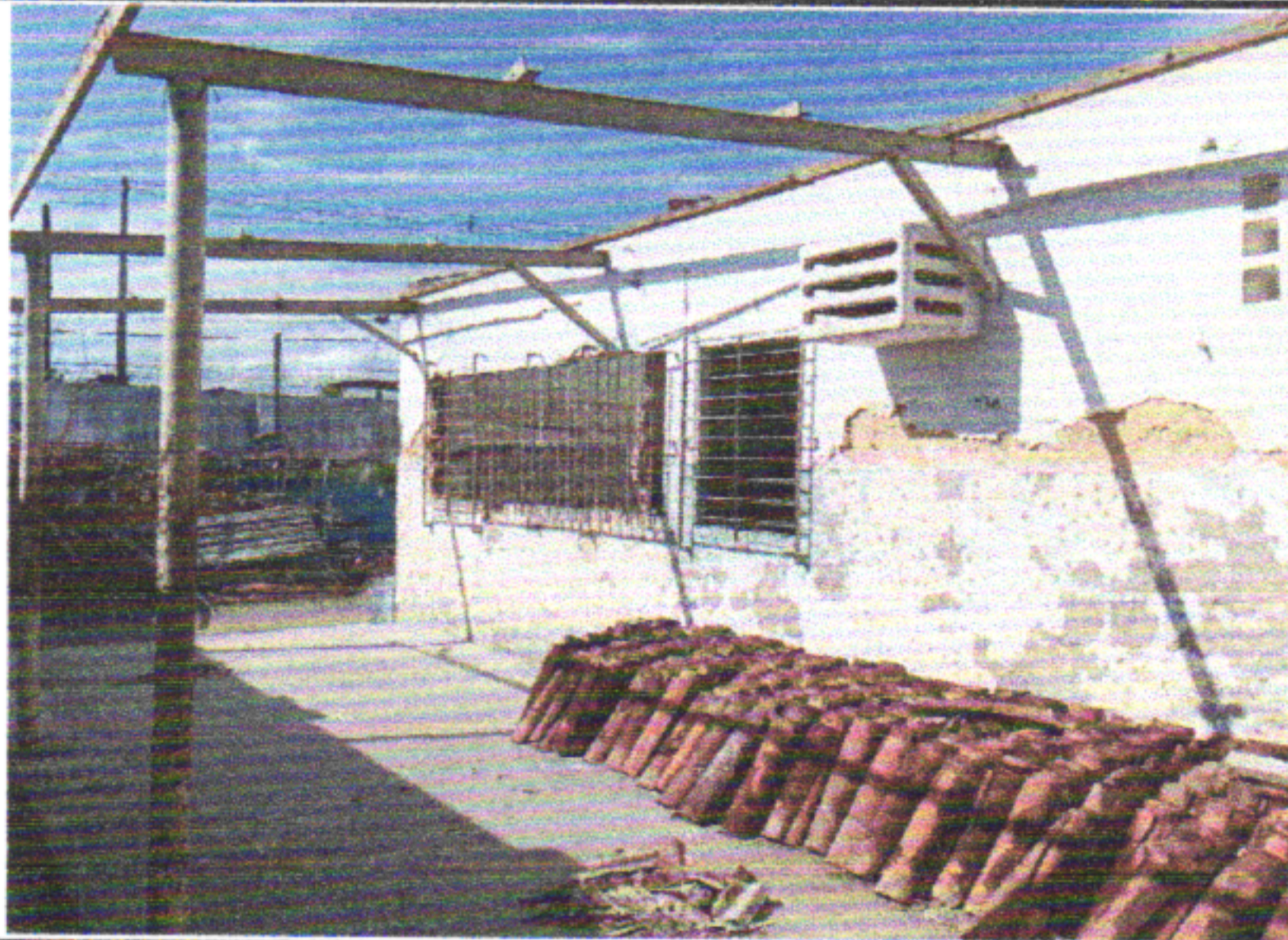
REMOÇÃO DE TRAMA DE MADEIRA PARA COBERTURA, DE FORMA MANUAL, SEM REAPROVEITAMENTO