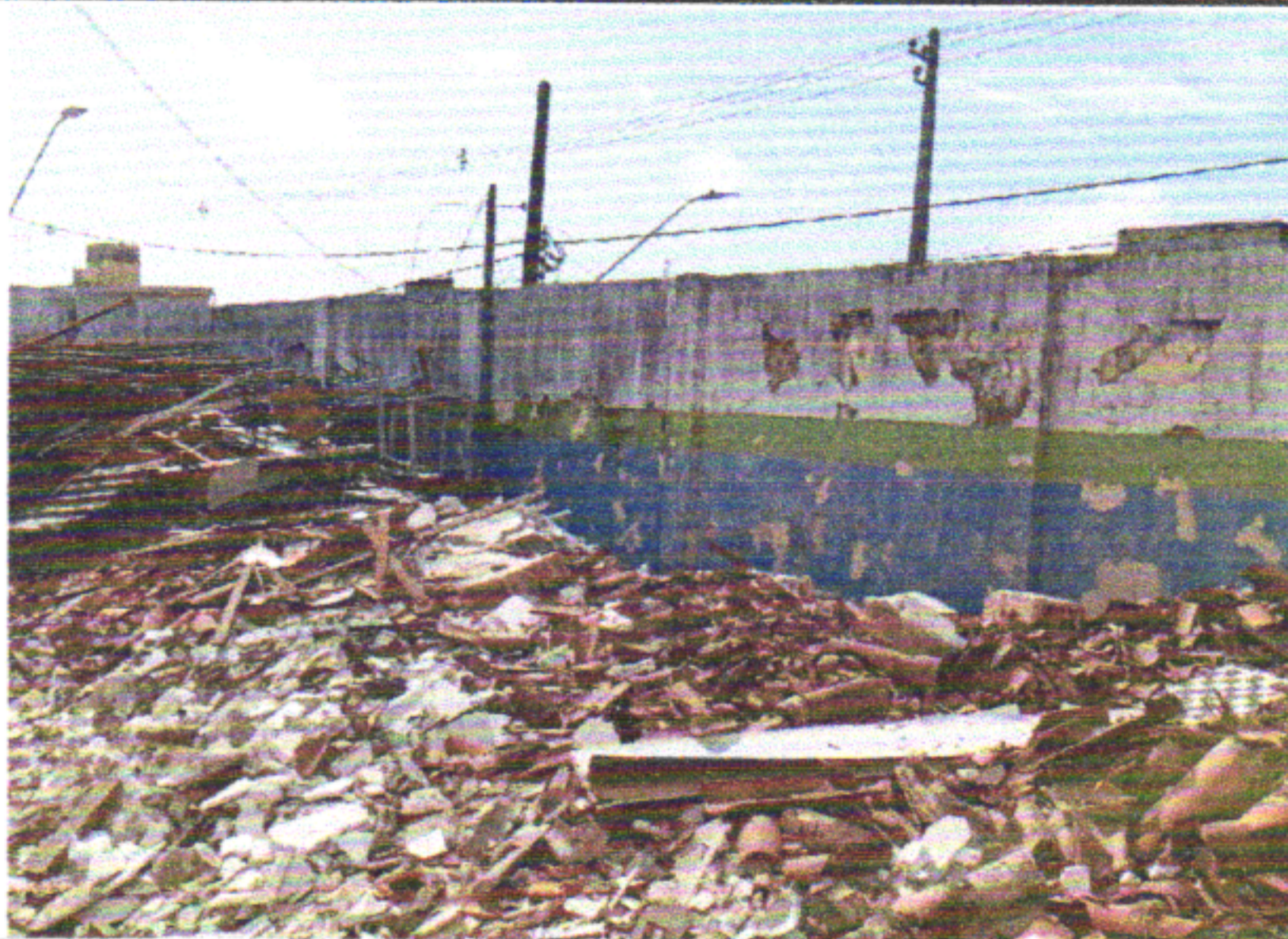
TRANSPORTE HORIZONTAL ATÉ 30M DE MATERIAIS À GRANEL