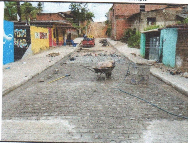
RUA BELÉM DE SÃO FRANCISCO - PAVIMENTAÇÃO