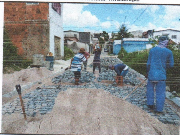
RUA BELÉM DE SÃO FRANCISCO - PAVIMENTAÇÃO