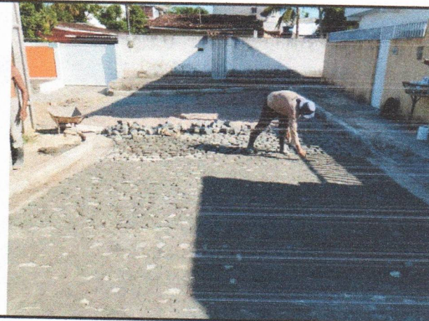
RUA BELÉM DE SÃO FRANCISCO - PAVIMENTAÇÃO