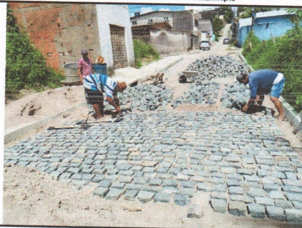
RUA BELÉM DE SÃO FRANCISCO - PAVIMENTAÇÃO