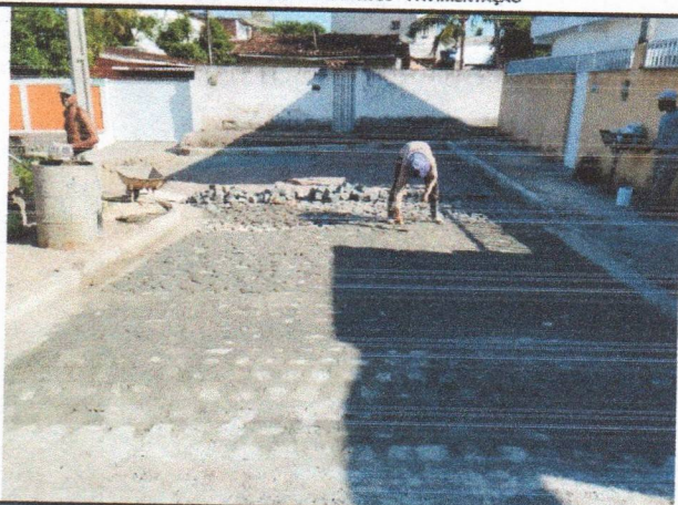
RUA BELÉM DE SÃO FRANCISCO - PAVIMENTAÇÃO