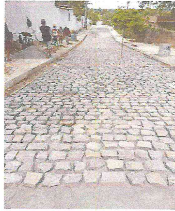
RUA ALAMEDA DO GIRASSOL (E0 à E21+5,00) - TIÚMA