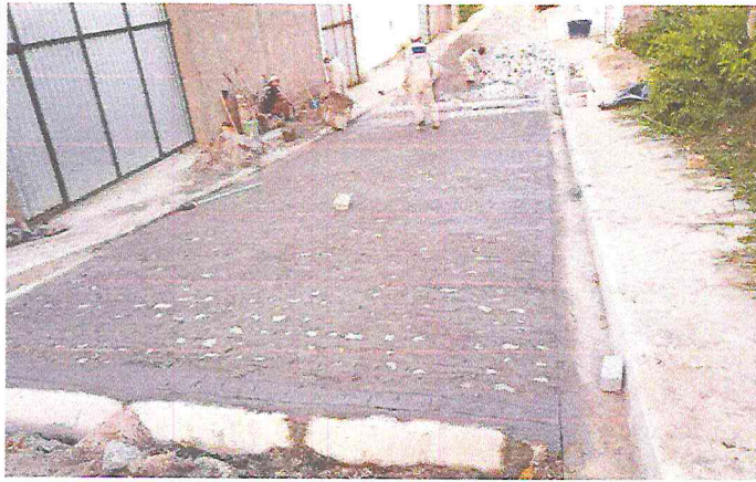
RUA ALAMEDA DAS PAPOULAS (E0 à E16) - TIÚMA