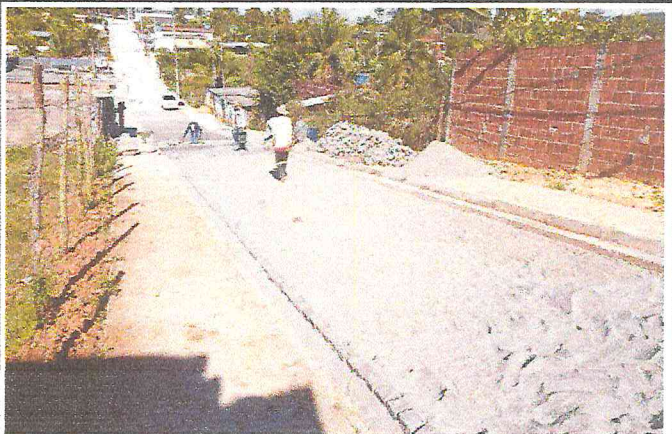
RUA ALAMEDA DAS PAPOULAS (E0 à E16) - TIÚMA