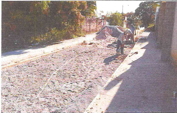
RUA ALAMEDA DAS PAPOULAS (E0 à E16) - TIÚMA