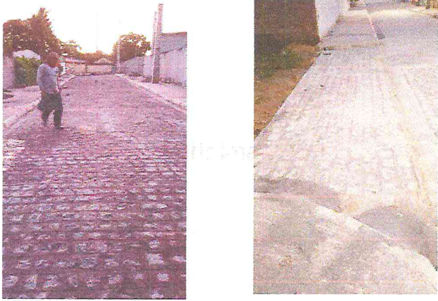
RUA ALAMEDA DAS PAPOULAS (E0 à E16) - TIÚMA