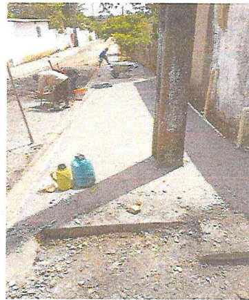
RUA ALAMEDA DO GIRASSOL (E0 à E21+5,00) - TIÚMA