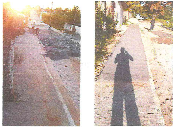
RUA ALAMEDA DAS PAPOULAS (E0 à E16) - TIÚMA