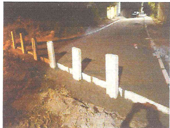
RUA ALAMEDA DAS PAPOULAS (E0 à E16) - TIÚMA