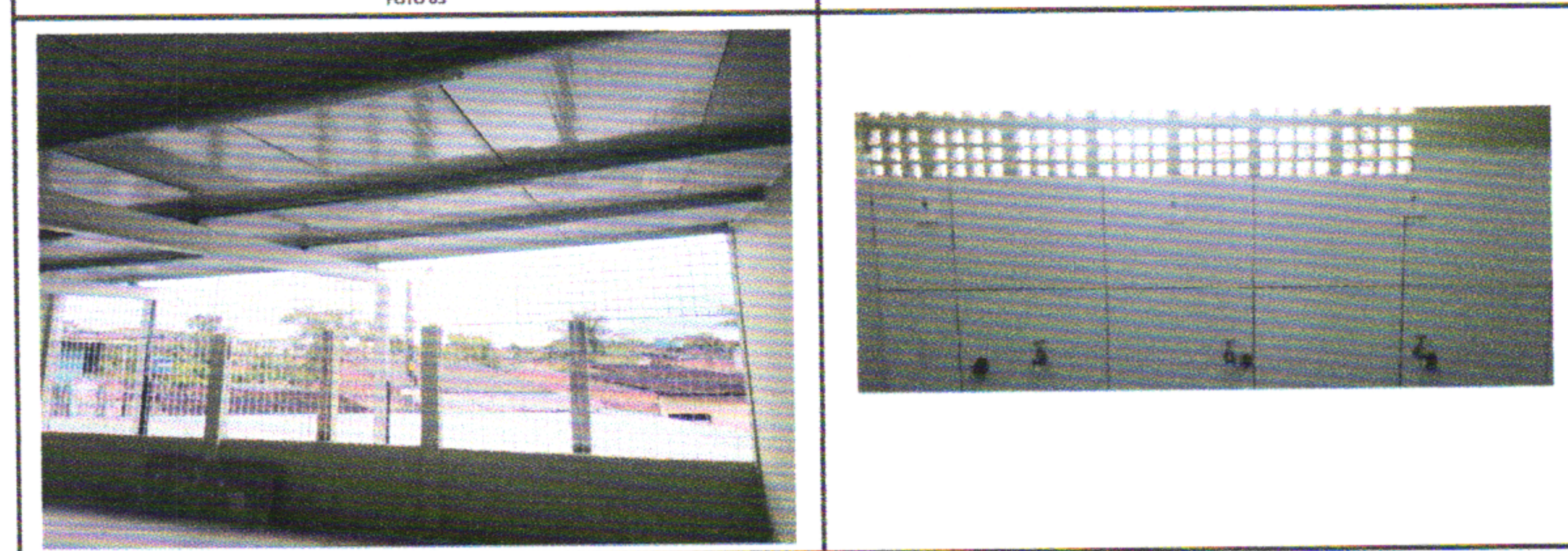
TELHAMENTO COM TELHA TERMOACÚSTICA PONTO DE TOMADA, PONTO DE HIDRÁULICA, PONTO DE ESGOTO 40MM