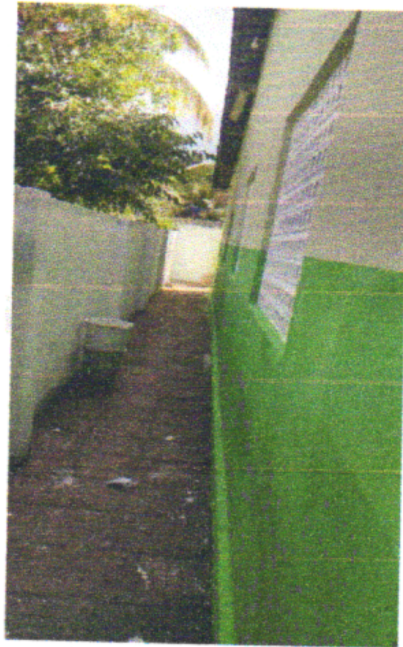
EXECUÇÃO DE PINTURA