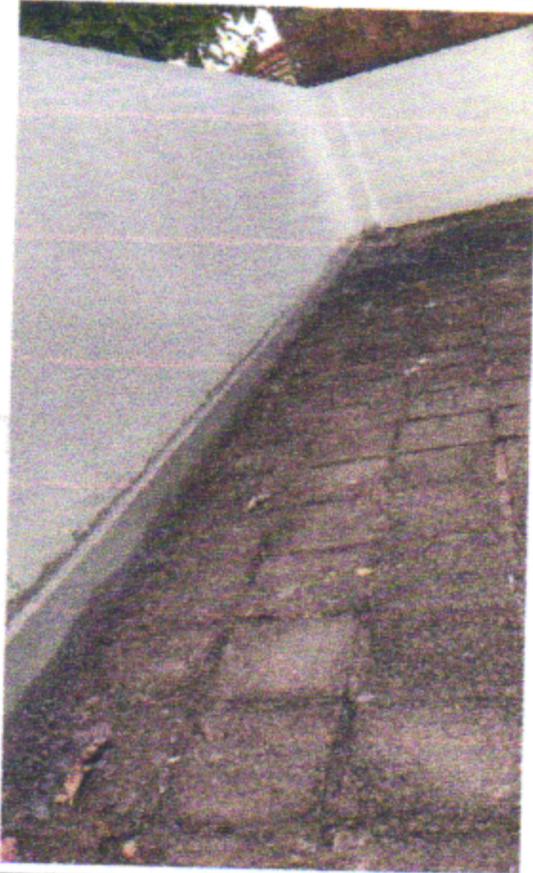
CAIAÇÃO DO MURO