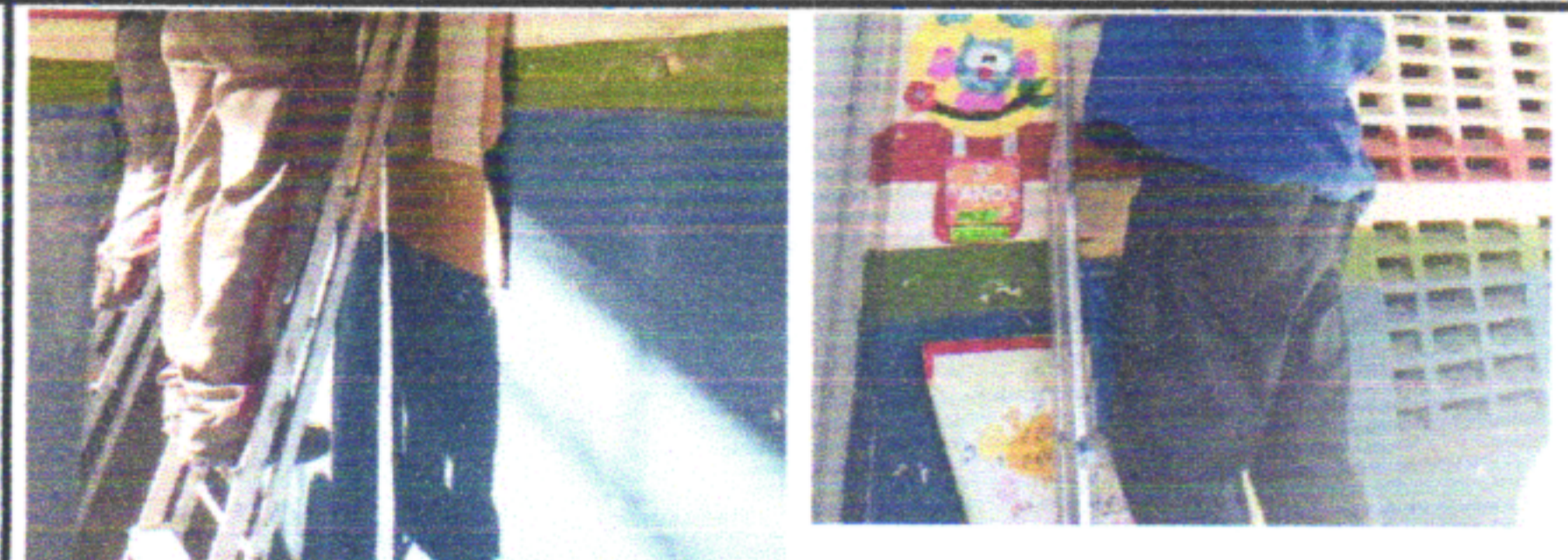
FORNECIMENTO E INSTALAÇÃO DE TUBULAÇÃO PARA AR-CONDICIONADO