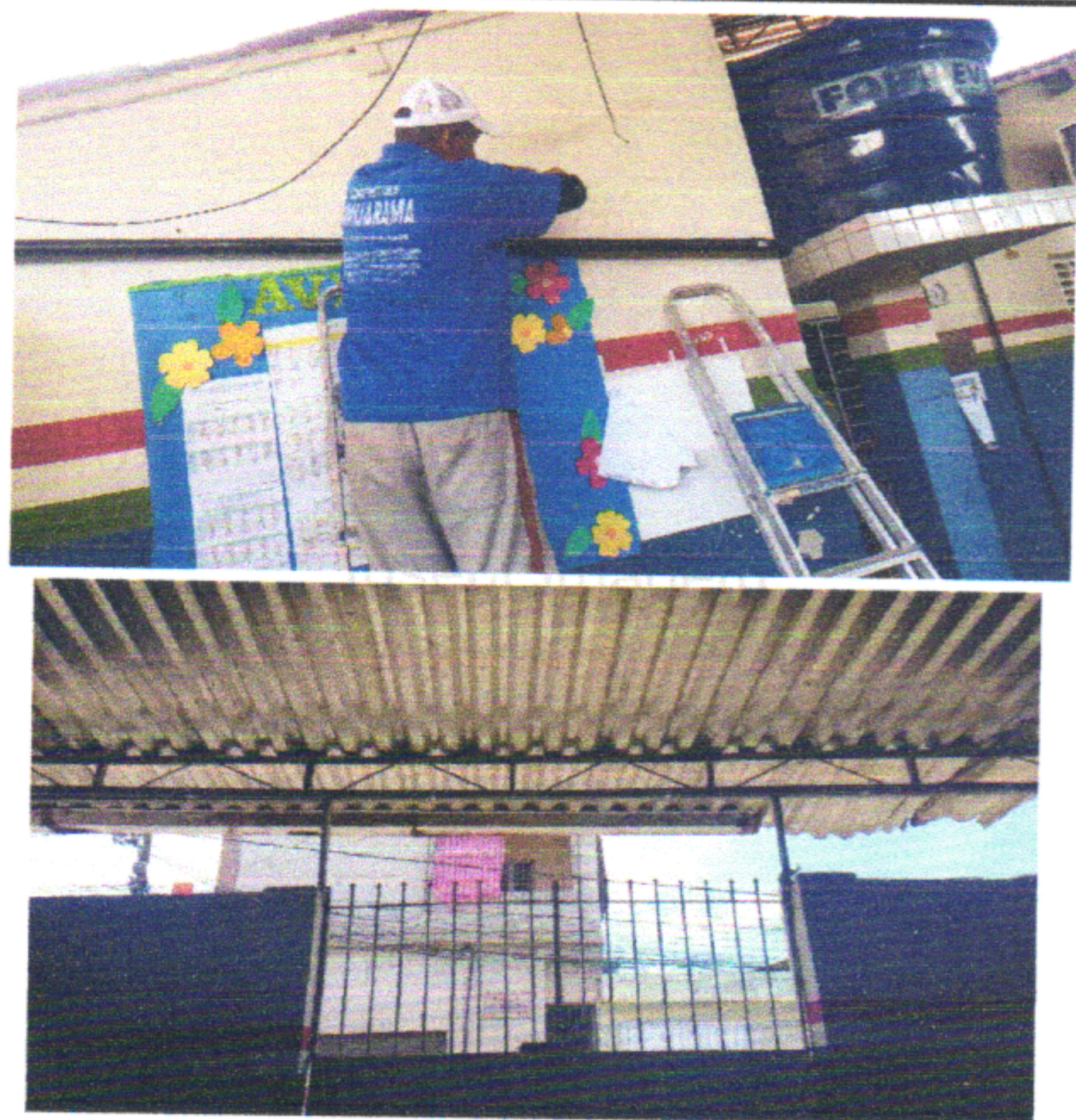
EXECUÇÃO DE TUBULAÇÃO NOVA PARA OS NOVOS CIRCUITOS