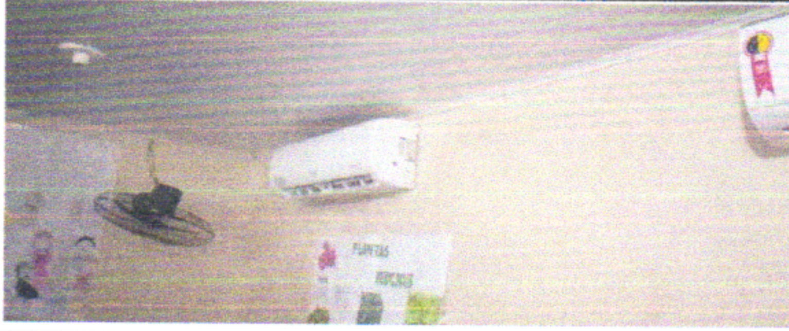
EXECUTAR TUBULAÇÃO NOVA E FIAÇÃO PARA AR-CONDICIONADO