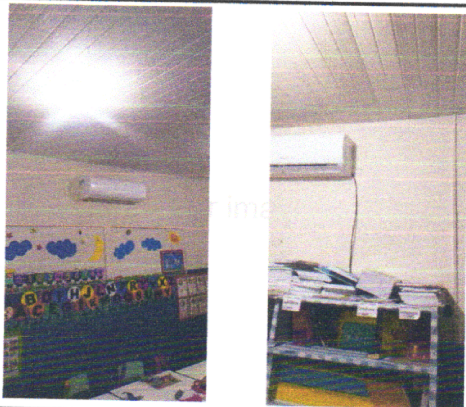
INSTALAR CONJUNTO ARSTOP PARA AR-CONDICIONADO