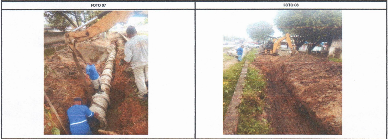
MOBI BRASIL MOBI BRASIL