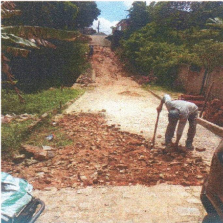
RUA FERNANDO CESAR