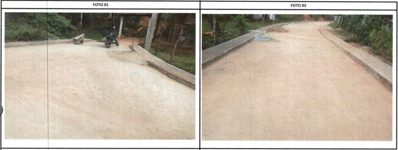
RUA PIAUÍ RUA PIAUÍ