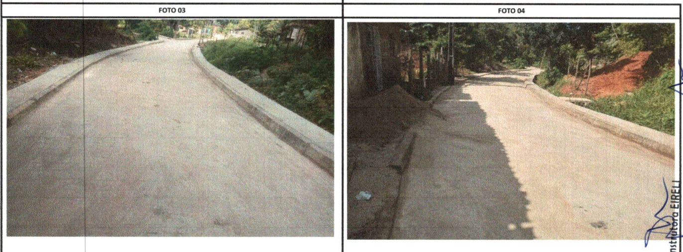
RUA PIAUÍ RUA PIAUÍ