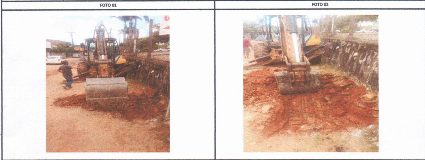
RUA CAROLINE BORBA DE LIMA