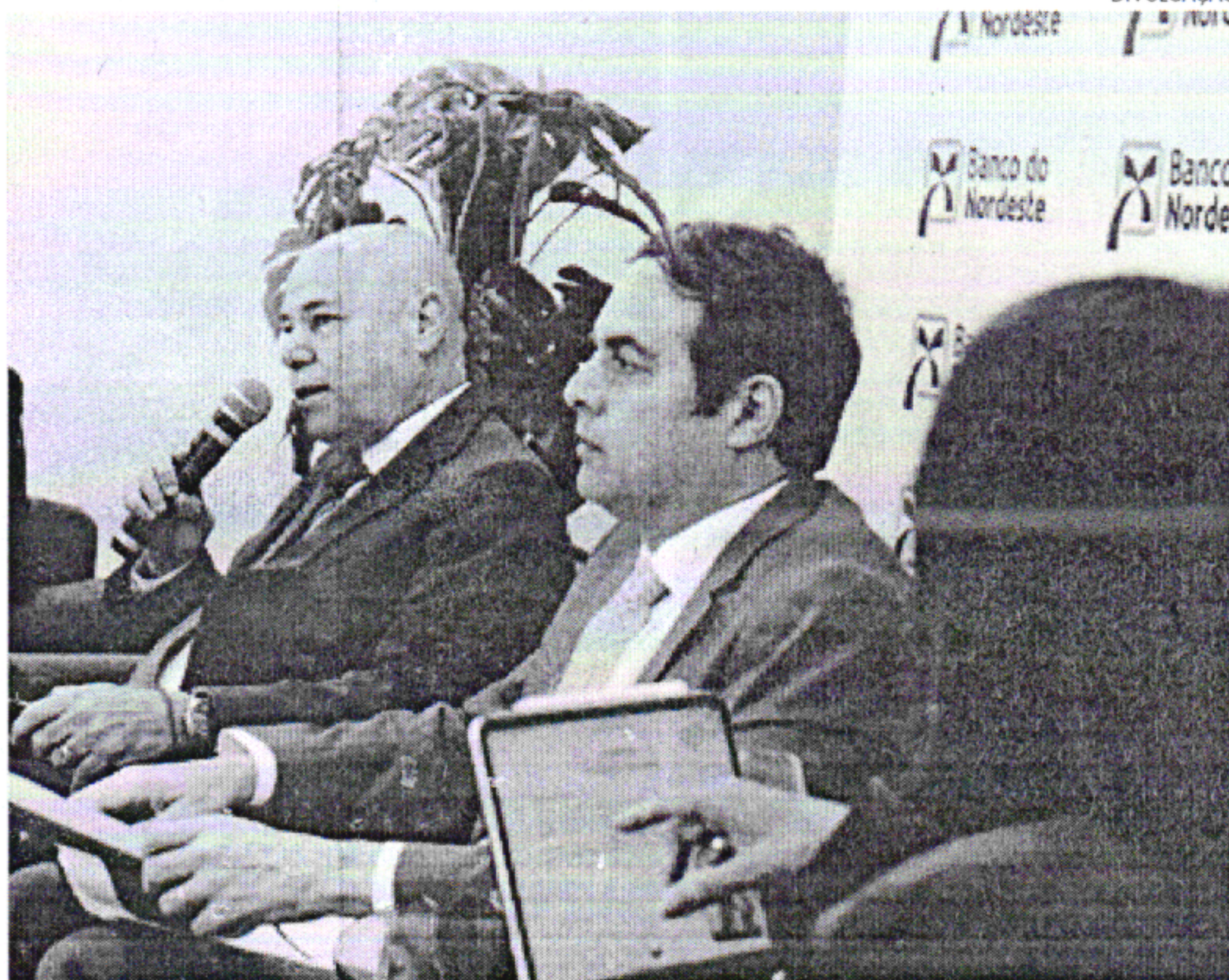
BNB comemora aumento dos desembolsos do FNE na primeira metade do ano

Ressalte-se a atuação do BNB no segmento de Micro e Pequenas Empresas (MPE),