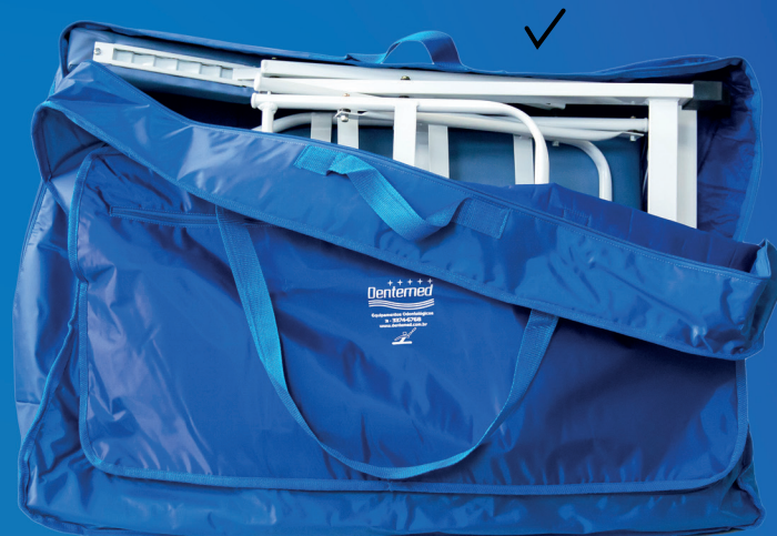
CADEIRA TRANSPORTÁTIL COM BANQUETA E BOLSA PARA TRANSPORTE