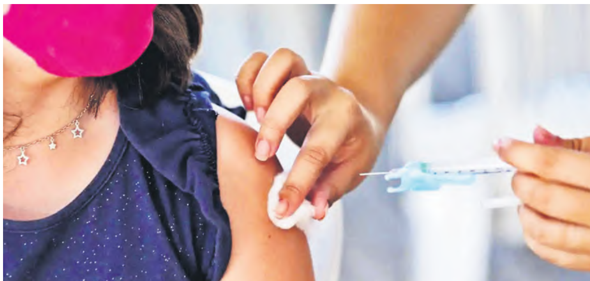
A Secretaria Estadual de Saúde ressalta que a população completa o esquema vacinal