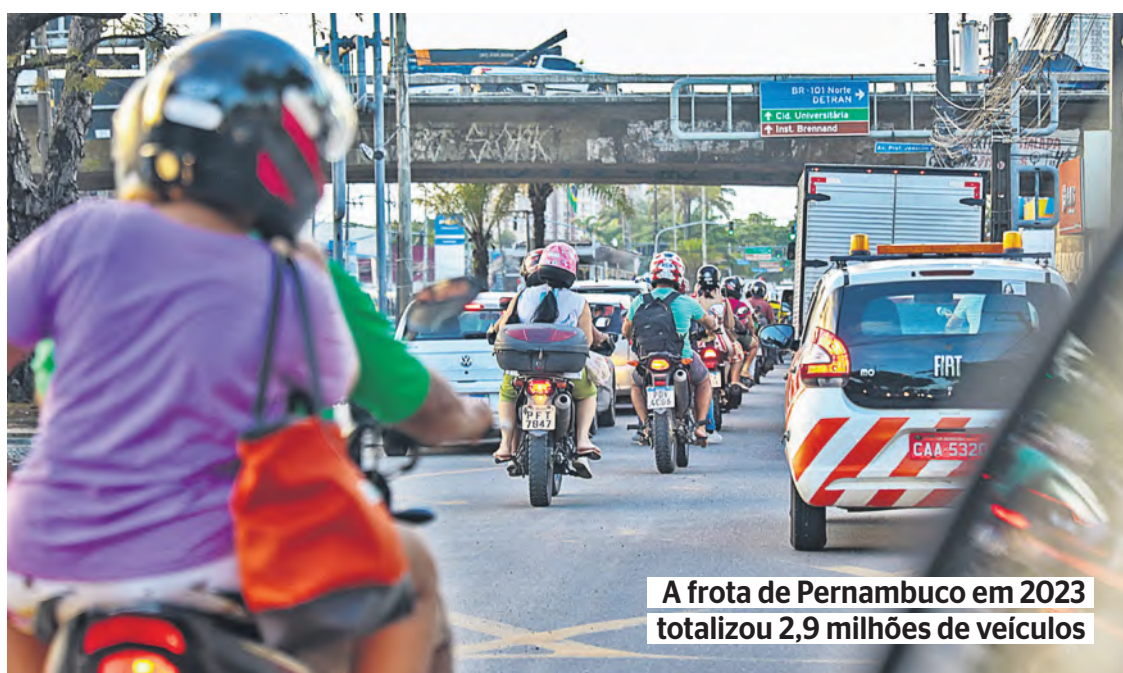
A frota de Pernambuco em 2023 totalizou 2,9 milhões de veículos