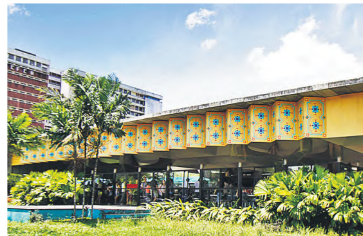
Relatório aponta erros no manuseio dos alimentos