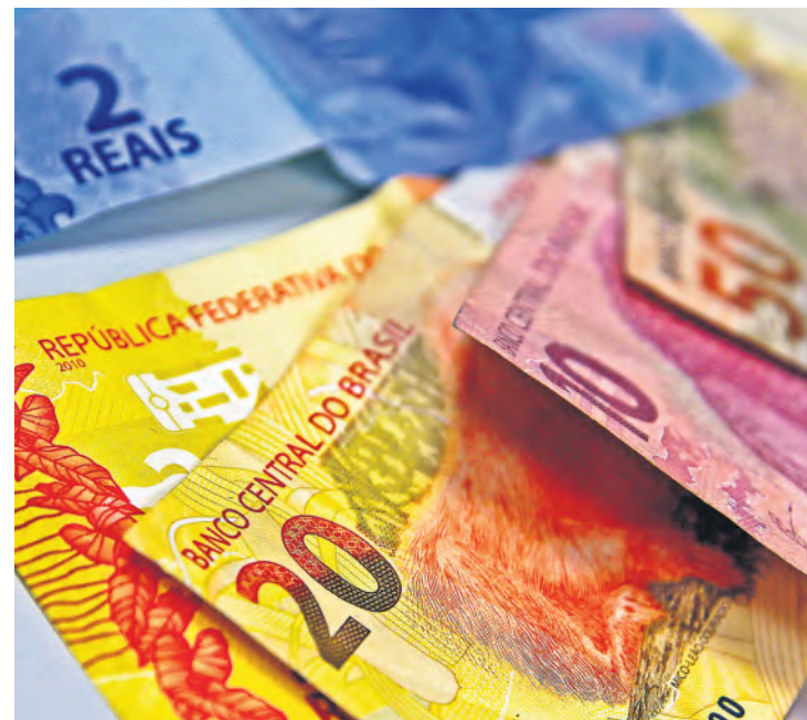
O reajuste real, ou seja, acima da inflação foi de 3%

A definição do novo valor deriva de uma fórmula que havia sido adotada durante os governos anteriores do PT, com base