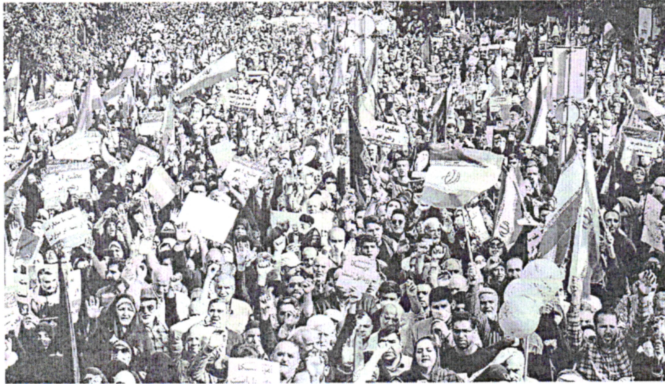
Onda de protestos gerou perseguição estatal, com mortes e prisões. Mundo repudia

No mesmo processo, outras duas pessoas foram condenadas a penas de prisão. Entre eles, está o jogador de futebol